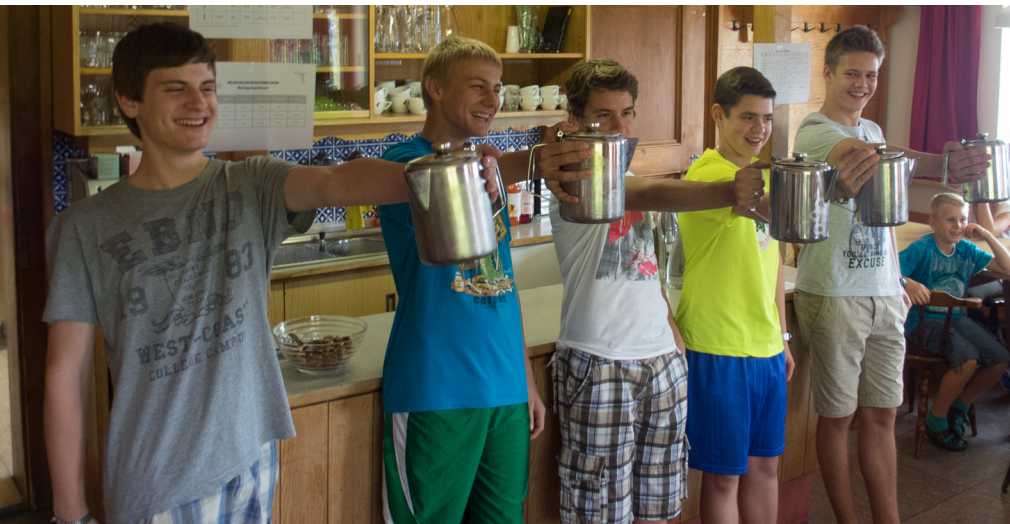
Starke Männer bei der ersten Challenge der Gruppenkämpfe!